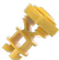
Amarelo Cód: 178