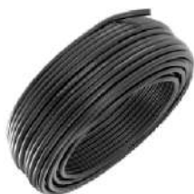
Preto Cód: 930