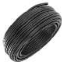
Preto Cód: 936