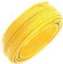
Amarelo Cód: 545