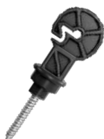
Preto Cód: 954