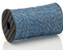
Variadas 250M Cód: 521