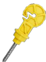
Amarelo Cód: 953