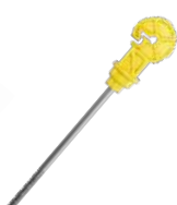
Amarelo Cód: 955