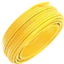
Amarelo Cód: 528