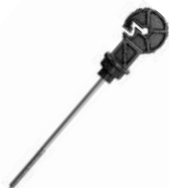
Preto Cód: 956