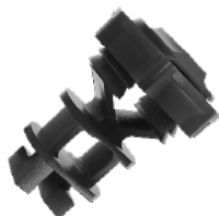
Preto Cód: 169